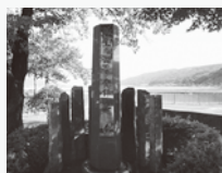
「寒の土用丑の日発祥の日」記念碑

また、感染症対策のため休憩時や施設利用時などは、マスク着用および手指消毒などの徹底をお願いします。