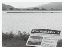
富士山と諏訪湖の眺望スポット