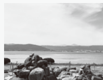
間欠泉の噴出地から望む諏訪湖