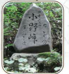
旧中山道小野峠碑