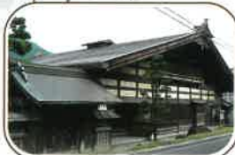
小野宿問屋(旧小野家住宅)