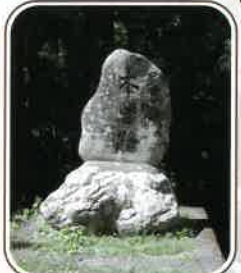
「是より南木曾路」の碑