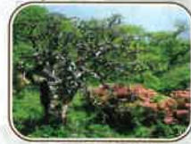
小野のしだれ栗自生地