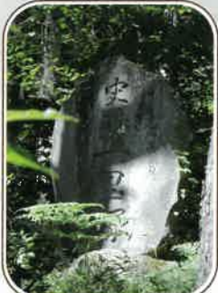
牛首峠 前山の一里塚